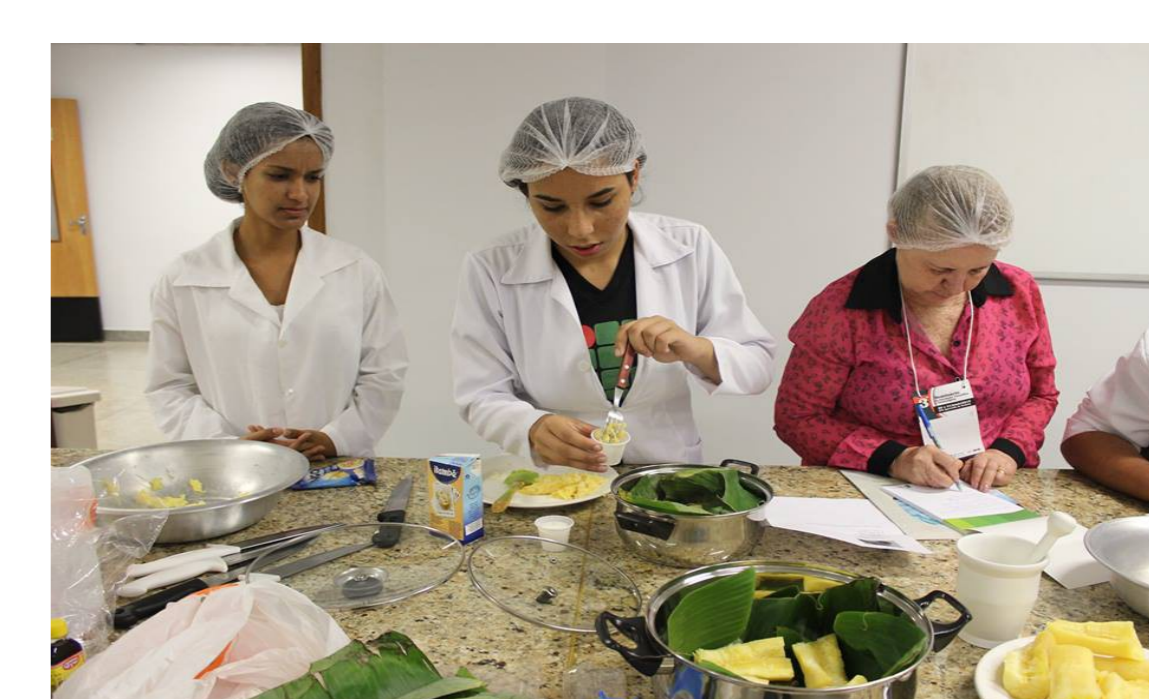
Figura 1 – Mandioca fermentada, bolinha de chuva, geladinho e preparação dos alimentos.